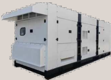
メタノール発電機